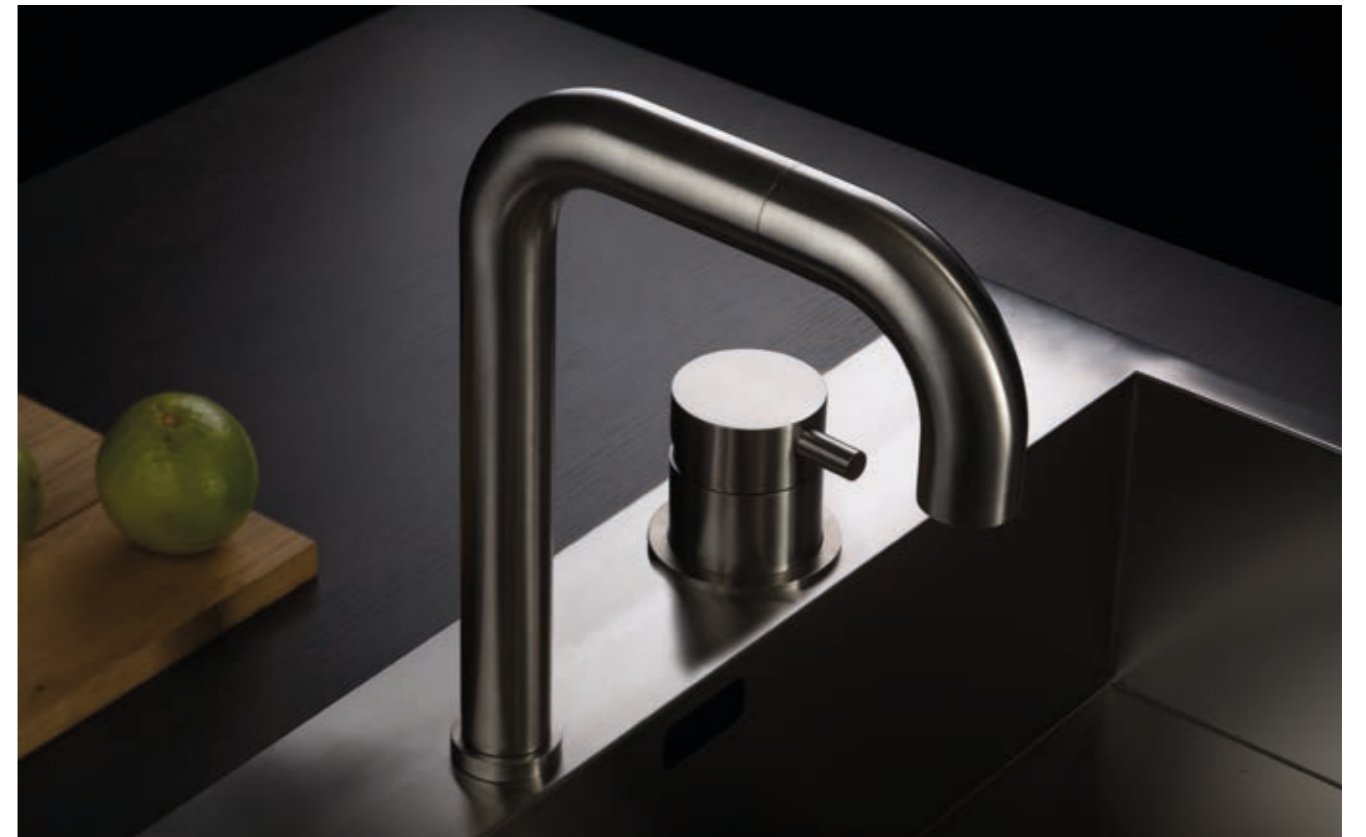
TIDE OVER 94074