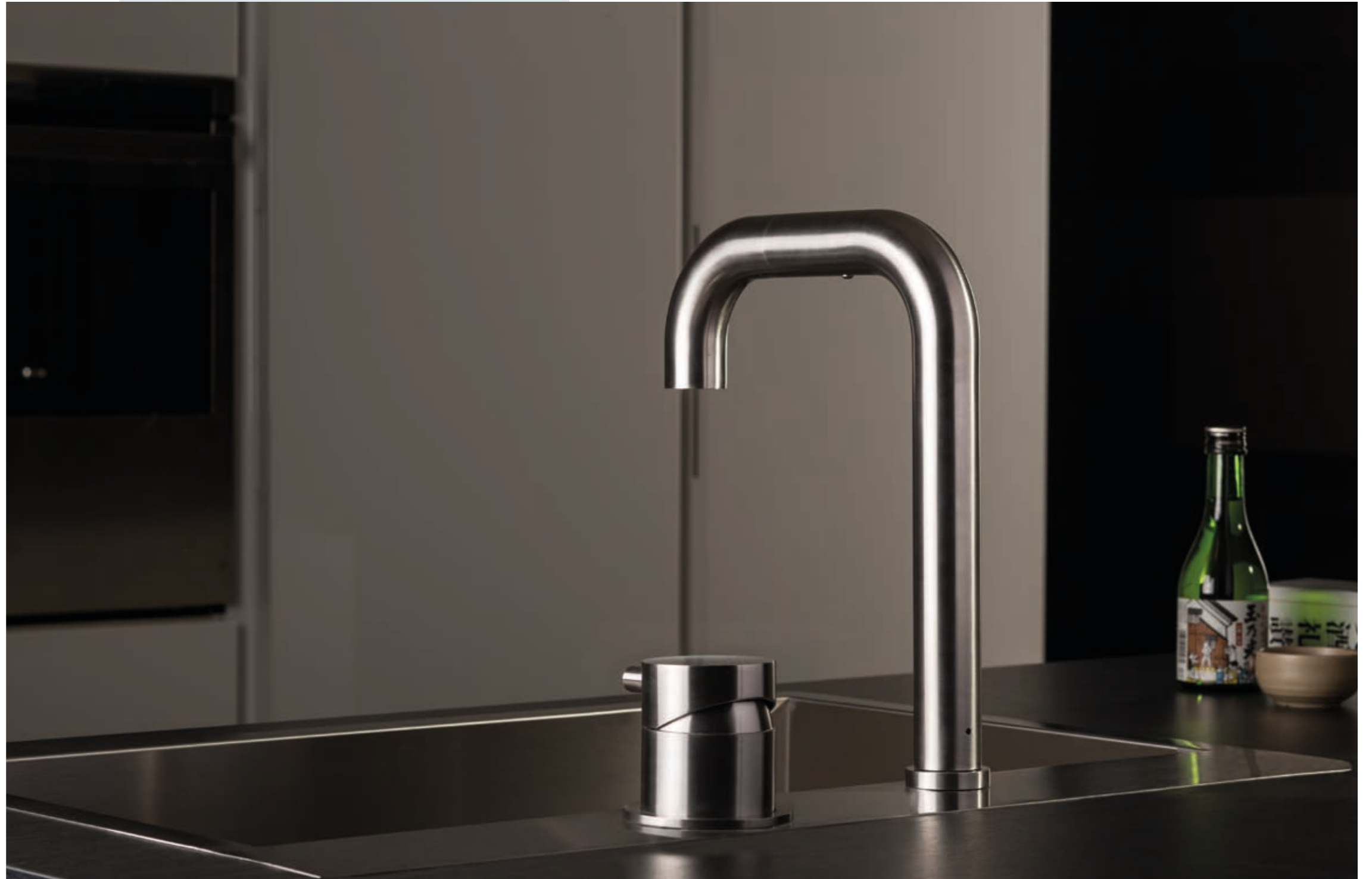
TIDE OVER 94074