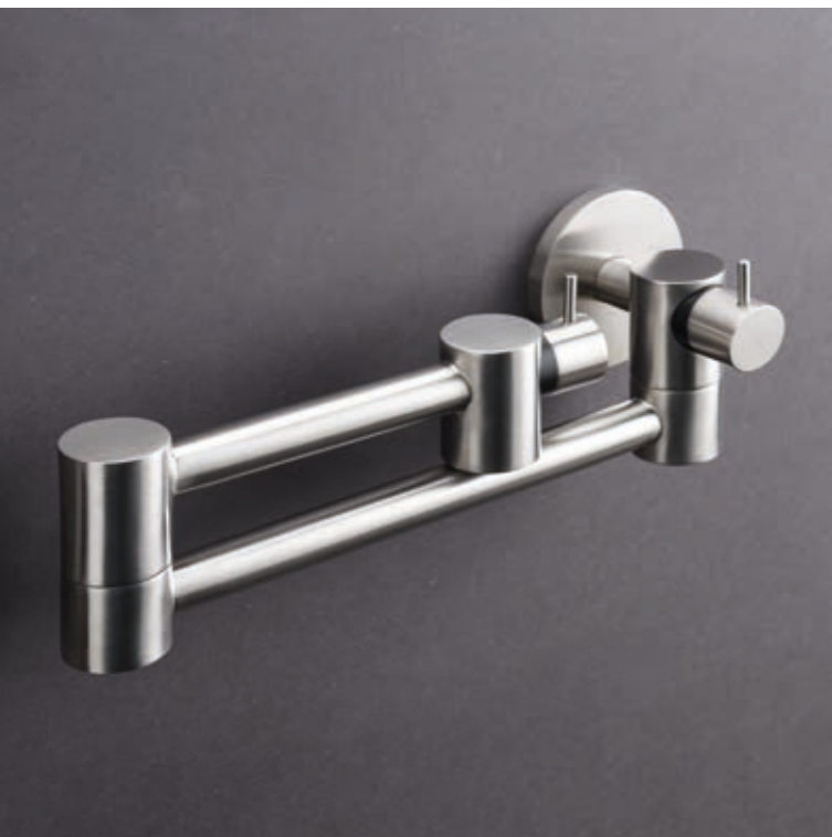
POT FILLER 9600