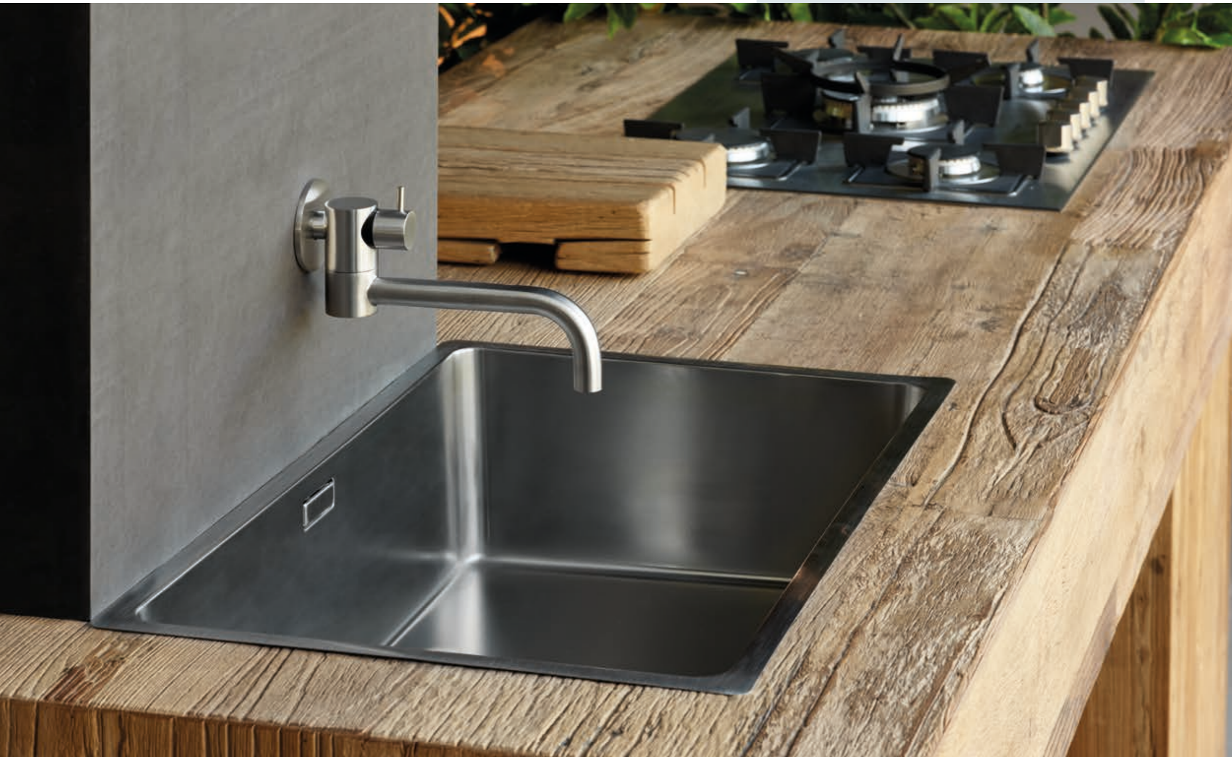
POT FILLER 96111