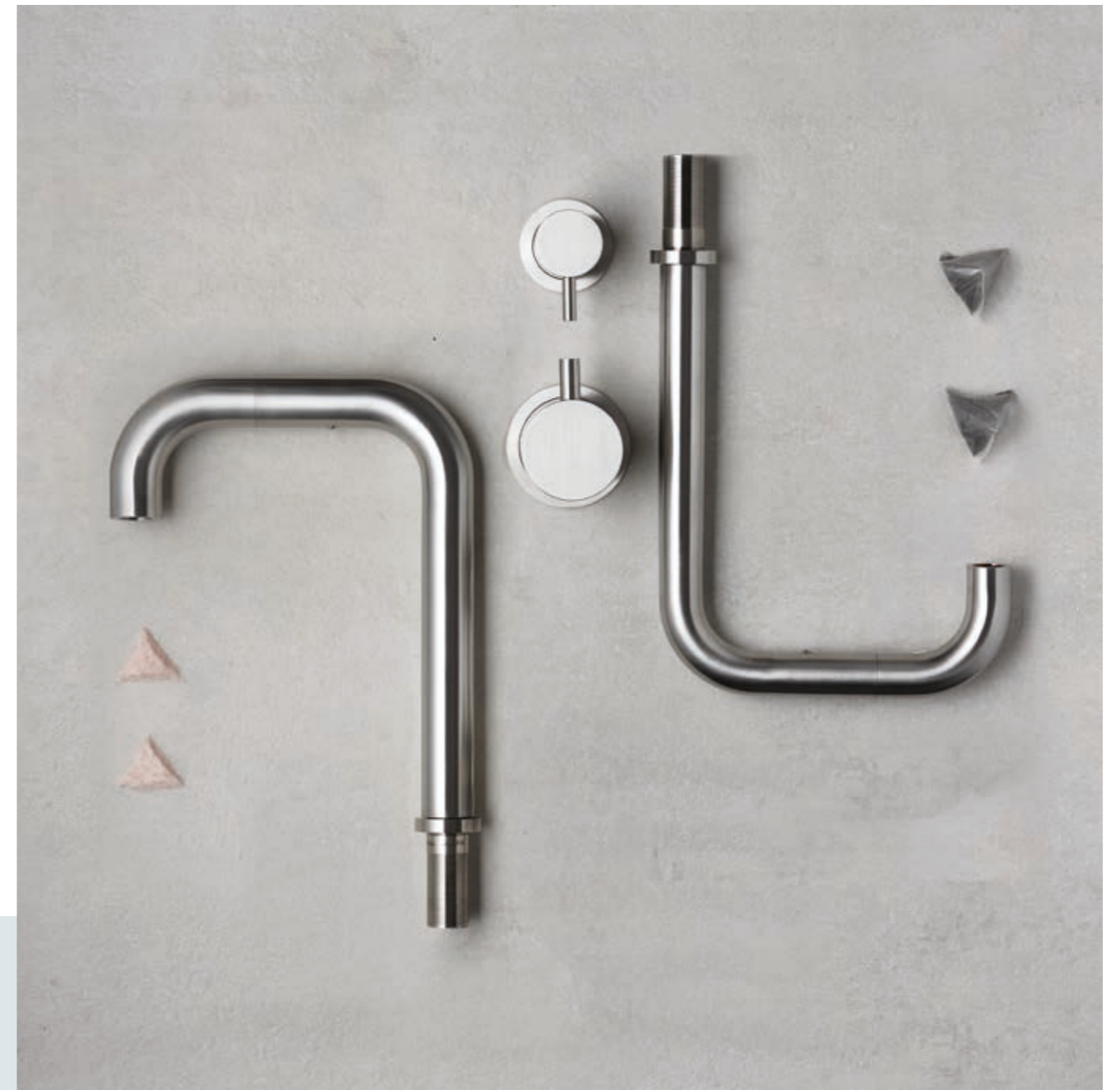
TIDE OVER 94074