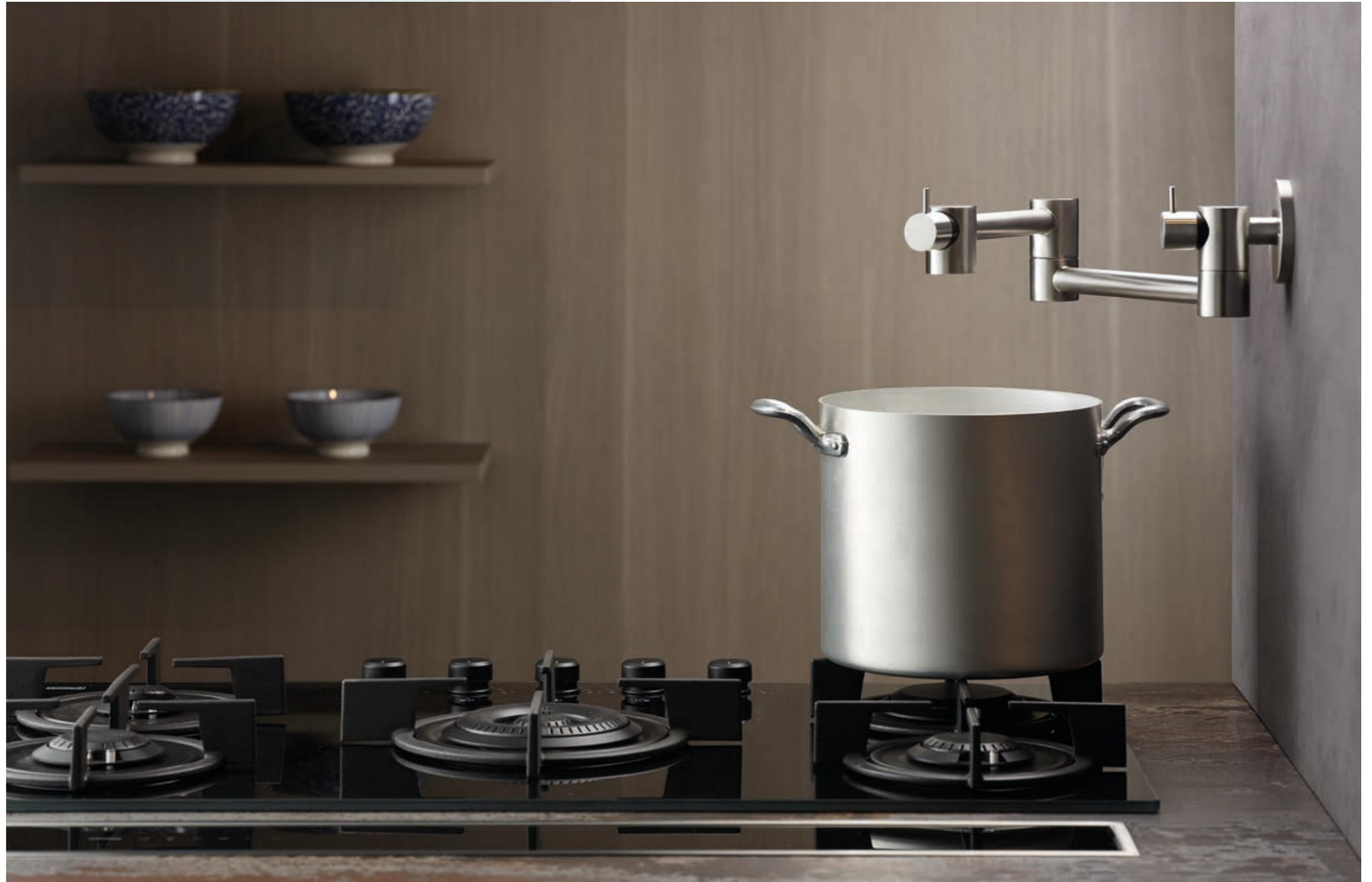
POT FILLER 9600